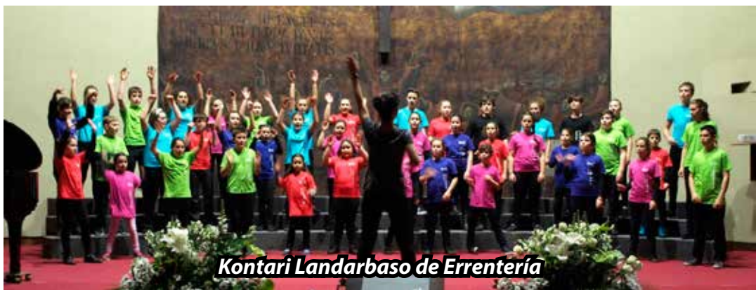
Kontari Landarbaso de Errentería