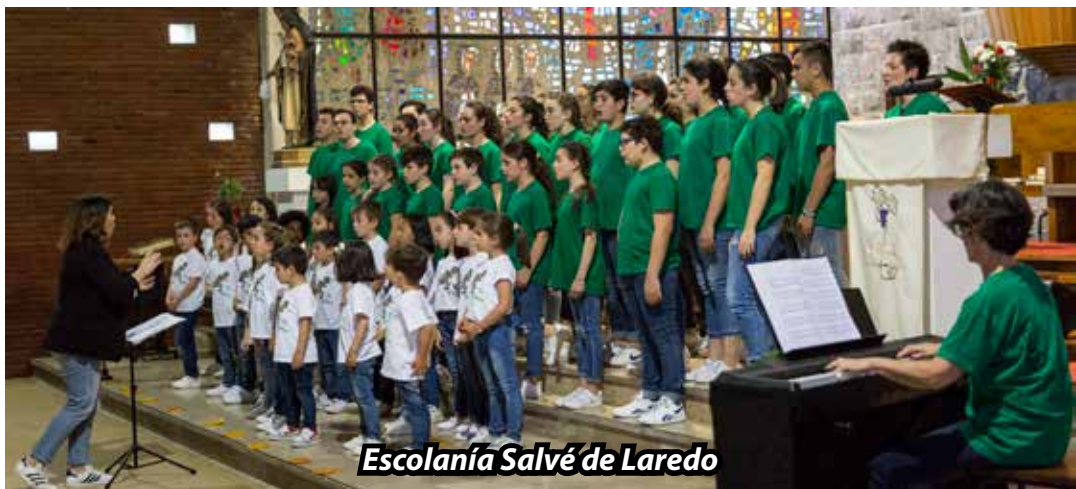
Escolanía Salvé de Laredo