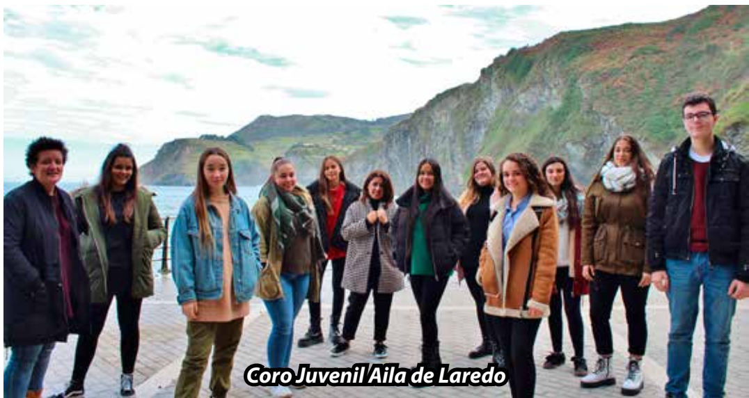
Coro Juvenil/Aila de Laredo