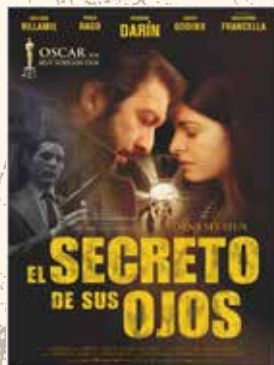
EL SECRETO DE SUS OJOS Juan José Campanella (Argentina 2009) 25 Noviembre