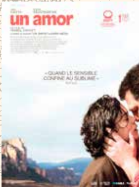
UN AMOR Isabel Coixet (España 2024) 28 Octubre

FILMOTECA REGIONAL EN LAREDO. Desde el 28 de octubre , cada martes cine en V.O.S. Horarios: 19:00 h. - Precio: 2 €