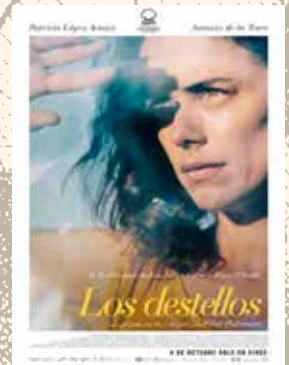
LOS DESTELLOS Pilar Palomero (España 2024) 9 DICIEMBRE