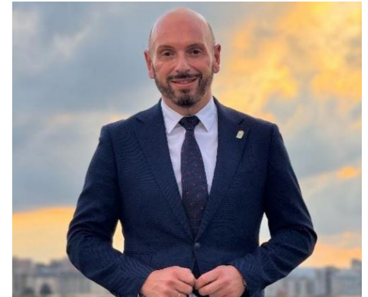
Alcalde del Exmo. Ayto. de Laredo; Miguel González González

La meta es clara: avanzar hacia un municipio más justo, incorporando la perspectiva de género en todas las políticas presentes y futuras. Además, este Plan no debe verse únicamente como una obligación normativa o como un mecanismo para garantizar la igualdad formal.