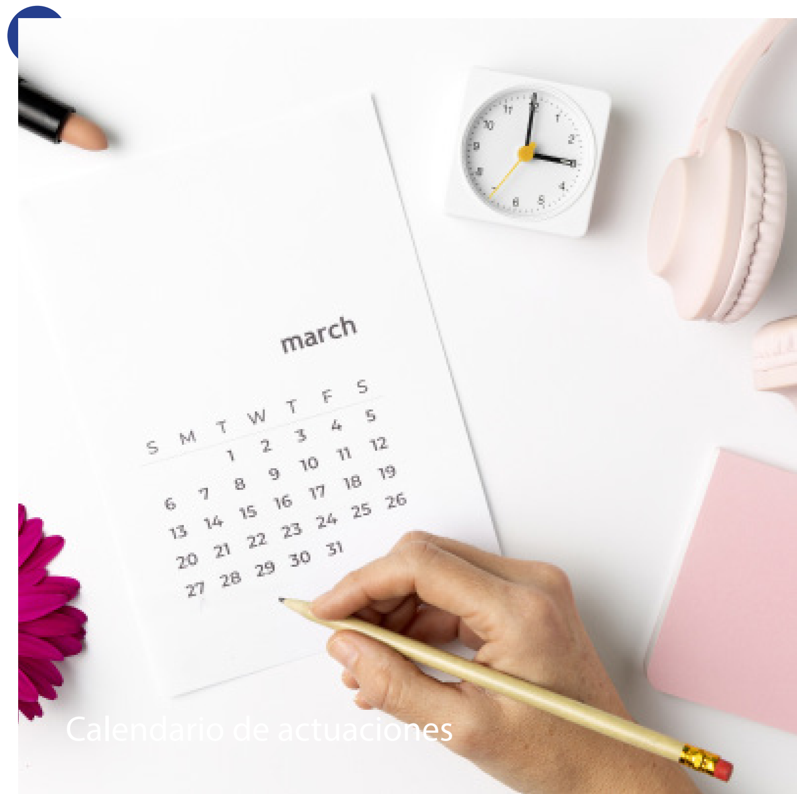
Calendario de actuaciones